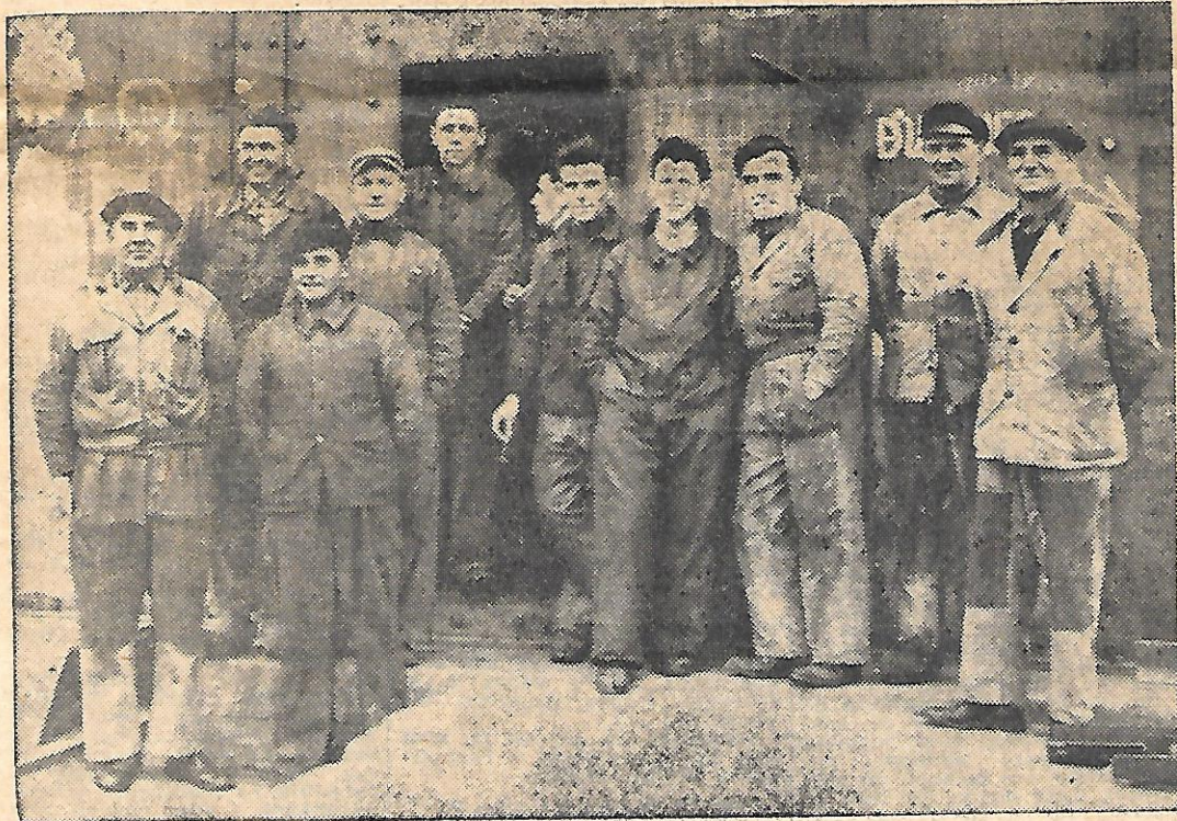
Un groupe des sympathiques ouvriers qui ont construit le chalutier-thonier

Le chalutier thonier Germaine-Anne-Marie est destiné à l'Armement Fournier-Charlot et consorts, de Concarneau.