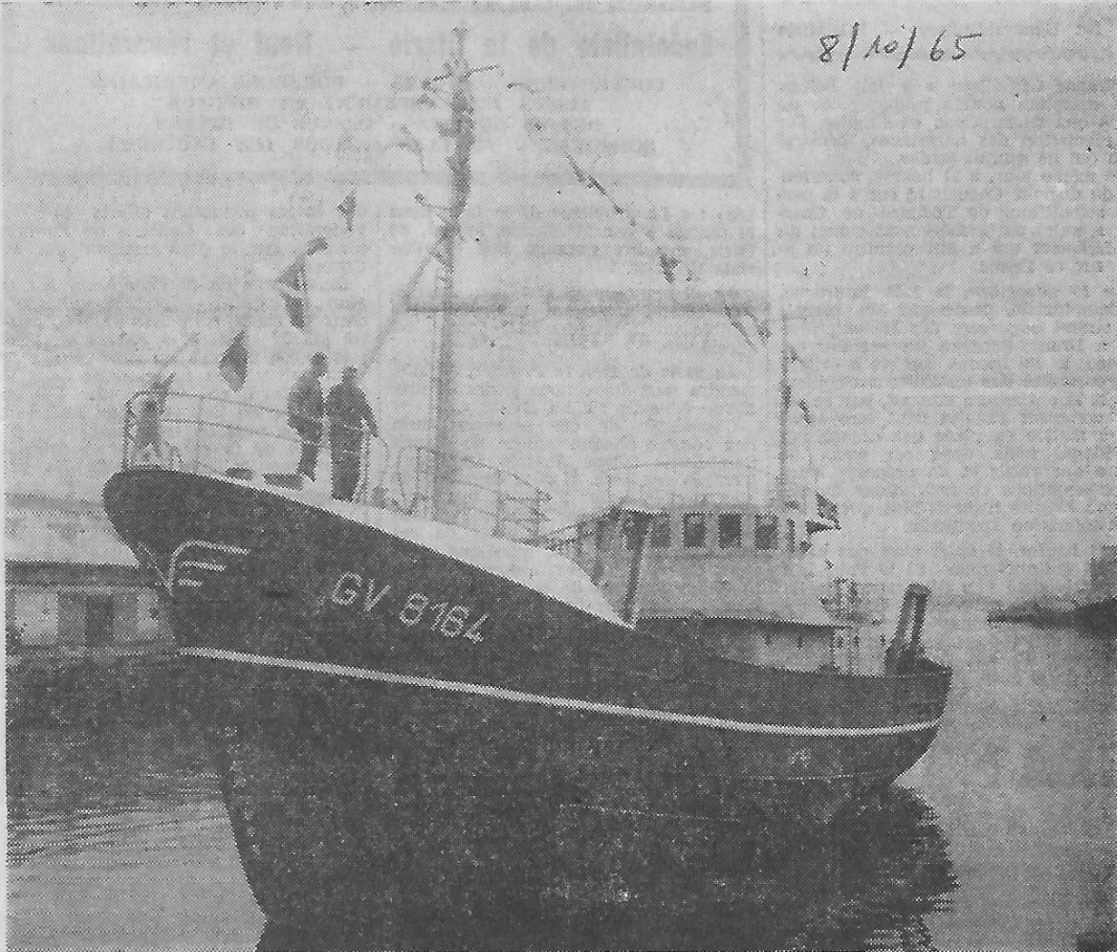
L'Ar-Men flotte... Il est manœuvré par un remorqueur de la S.P.P.L.