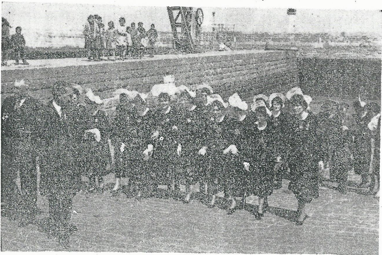
Les jeunes filles du Cercle Celtique Jean-Pierre Calloch étaient à l'arrivée du bateau